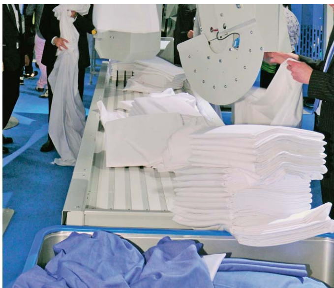
Sl.2 Posjetitelji će moći vidjeti opsežnu ponudu koje će zadovoljiti njihove potrebe i standarde vrhunske kvalitete, higijene i održivosti

EXPOdetergo International 2018 opet će predstaviti najbolje tehnike i proizvode za čišćenje, glačanje i nje-